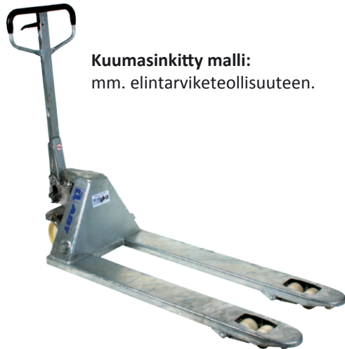
Kuumasinkitty malli: mm. elintarviketeollisuuteen.