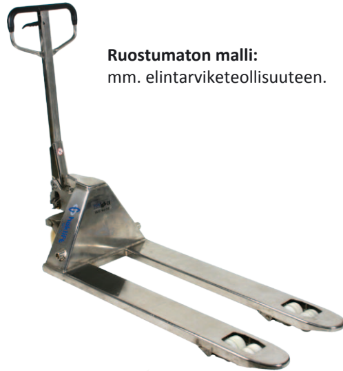
Ruostumaton malli: mm. elintarviketeollisuuteen.